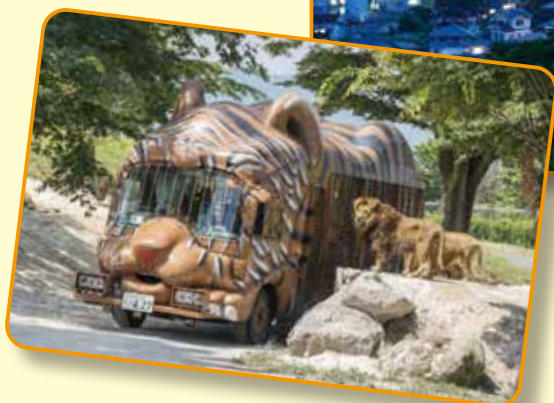
宇佐市「九州自然動物公園アフリカンサファリ」