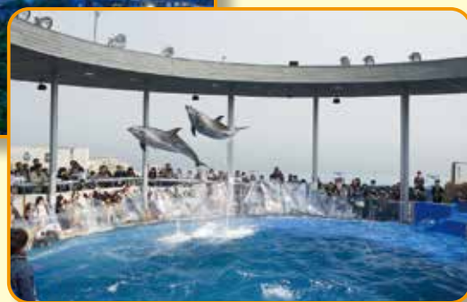
大分市「大分マリーンパレス水族館「うみたまご」」