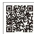
「全保協 将来ビジョン」

※「全保協 将来ビジョン」およびビジョンにもとづく「共通研究テーマ」については、全国保育協議会のホームページでご確認できます。右記のQRコードからダウンロードください。